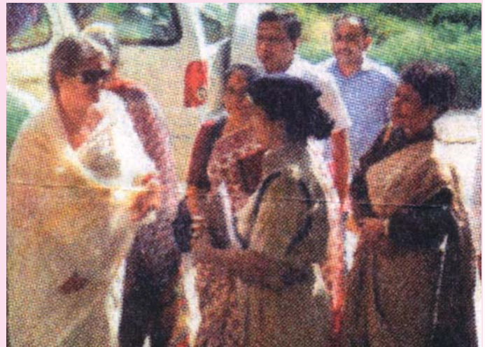
वनस्थली विद्यापीठ में अध्यक्षा