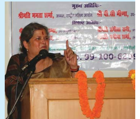
राष्ट्रीय महिला आयोग की अध्यक्ष श्रोताओं को संबोधित करते हुए

कन्या भ्रूण हत्या पर एक लघु डॉक्यूमेंटरी दिखाई गई और परिवार और समाज में कन्या के महत्व पर एक स्किट पेश किया गया।